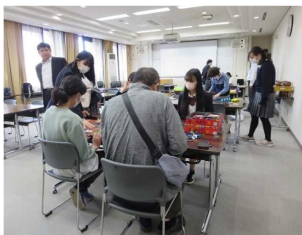
ボードゲームイベント