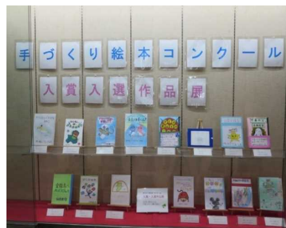
手づくり絵本コンクール入賞作品展示