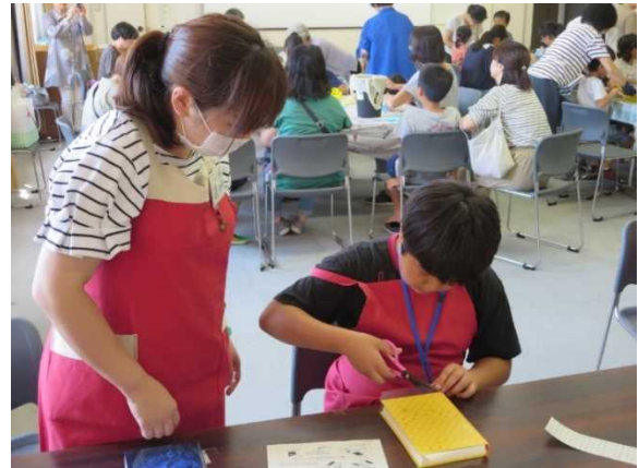
ブックカバー体験