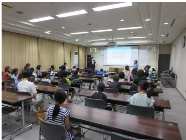
みるく教室（夏休みイベント）