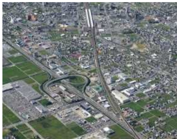
名神高速道路岐阜羽島インターチェンジ