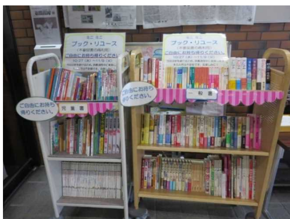
ミニミニブックリユース