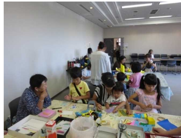
おりがみであそぼう！（共催イベント）