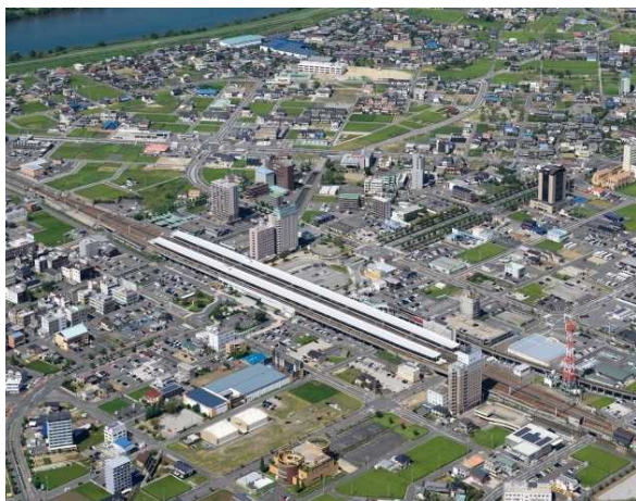
新幹線岐阜羽島駅